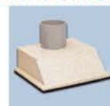
ES 110 / 160