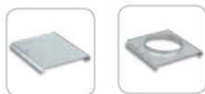
Imagem do produto aplicado: