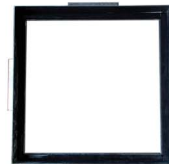
Aro com Vedação Neoprene