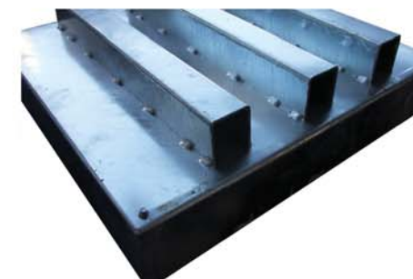
Reforços Internos – Classe C250